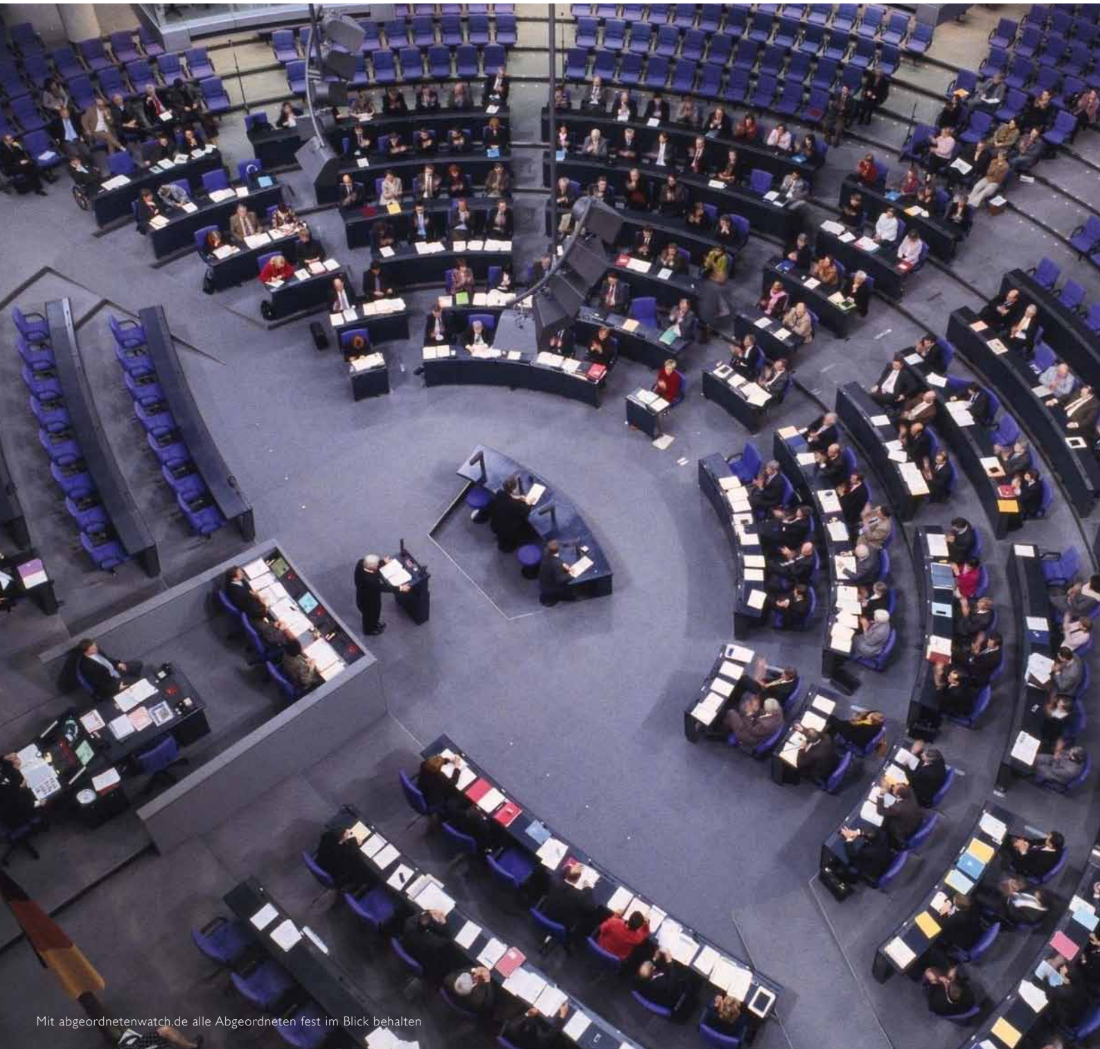
Mit abgeordnetenwatch.de alle Abgeordneten fest im Blick behalten

„ abgeordnetenwatch.de nutzt das Medium Internet in hervorragender Weise, um Politik transparenter und bürgernäher zu machen. Damit leistet diese Einrichtung einen wertvollen Beitrag zur Demokratie.“