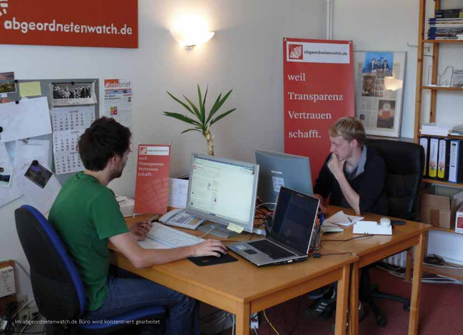
Im abgeordnetenwatch.de Büro wird konzentriert gearbeitet