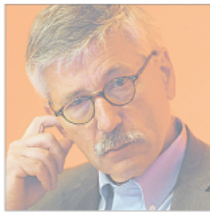
Provokant: Theo Sarrazin. DDP