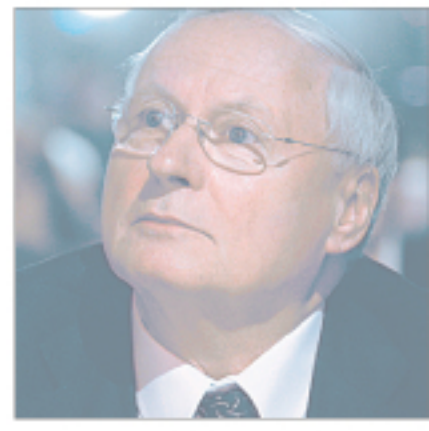
Hoffnungsfroh: Oskar Lafontaine.

se der Bosse“ hervor und ergötzte sich öffentlich nicht nur an Clements Rausschmiss, sondern machte auch noch weitere „Ekelpakete“ auf dem rechten SPD-Flügel aus, die man ihm „hinterherwerfen“ solle. Damit meinte er Otto Schily, Clements Anwalt im Schiedsverfahren, der in seiner letzten Legislaturperiode als Bundestagsabgeordneter heftig an den Nerven vieler Genossen sigt. Und den Berliner Finanzsenator Theo Sarrazin, der sich darin gefällt, Hartz IV-Beziehern Ratschläge für preiswerte Verköstigung und zur Minderung der Heizkosten durch das Anziehen zusätzlicher Pullover zu geben.