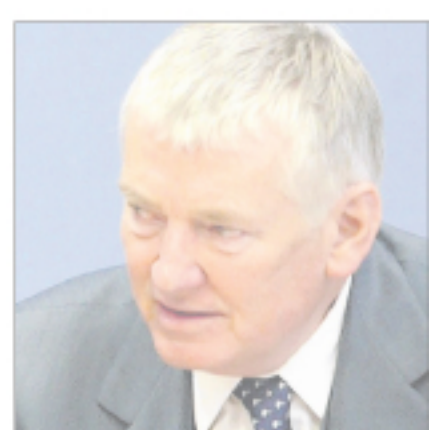
Eigenwillig: Otto Schily.